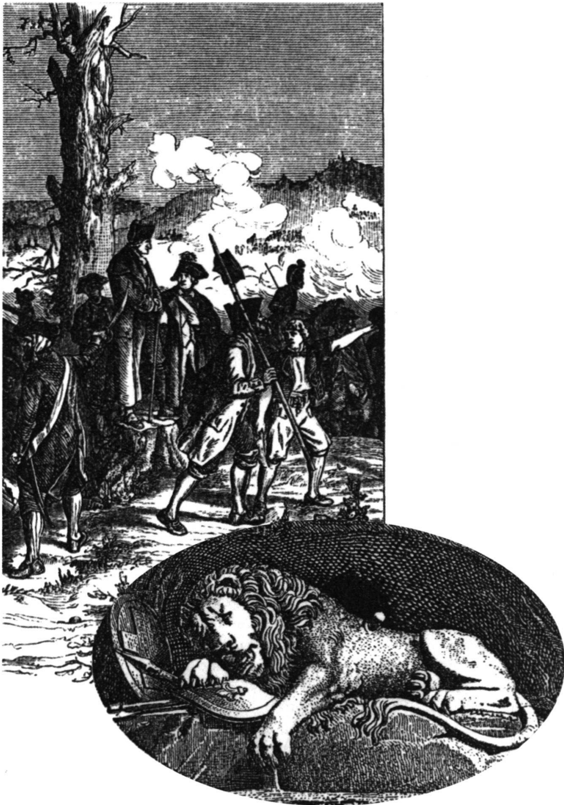
Abb. 24: In den Lesebüchern von Hunziker und Keller erscheint der Untergang der alten Eidgenossenschaft getreu der eidgenössischen Tradition auch in den Abbildungen vor allem als Erzählung eines heroischen Kampfes. Sowohl der sterbende Löwe von Thorwaldsen wie die Darstellung des gebeugten Schultheissen Steiger, der im Grauholz die Abwehrschlacht Berns beobachtet, unterstreichen diese Haltung.