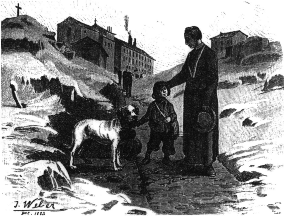
Die Hunde vom St. Bernhard.

Abb. 21: Die Hunde von St. Bernhard, ein Dauerbrenner im aargauischen Lesebuch. Hier in einer Bildversion aus dem Achtklassesebuch von Hunziker/Keller.