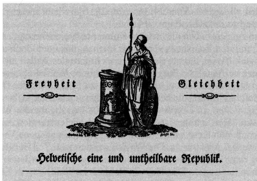
16 Helvetischer Briefkopf, verwendet von der aargauischen Verwaltungskammer im Jahr 1801. Die Frauengestalt, welche mit dem antiken Gewand, mit Schild und Speer an die griechische Göttin Athene erinnert, verkörpert die Freiheit. Auf der Säule links ist Wilhelm Tell mit seinem Sohn zu erkennen.

Der zunehmende Druck von oben, wie er in den folgenden Kapiteln zur Darstellung kommen wird, erzeugte Gegendruck, eine versteifte Haltung der Gemeindeversammlungen. Mehr und mehr nahmen sich diese auch Rechte heraus, die sie nicht gehabt hätten. Wir haben von Reinach und Beinwil gehört, die durch eigenwilliges Verhalten die Verkleinerung ihrer Munizipalitäten ertrotzten, und von Menziken, wo schliesslich bloss noch zwei Beamte wirkten, weil sich die Gemeinde schlicht weigerte, zusätzliche zu wählen. Anderswo wurden unbewilligte Versammlungen abgehalten – in Oberkulm schon im November 1798 (S. 170) –, oder genehmigte Versammlungen wurden zu antihelvetischen Umtrieben missbraucht, besonders im Frühjahr 1799 (S. 156, 161, 190 ff.). So oder so zeigten die Gemeindeversammlungen auch in den fünf Jahren der Helvetik echtes Leben. Unterbinden liess sich die lokale Freiheit nur bis zu einem gewissen Grade.