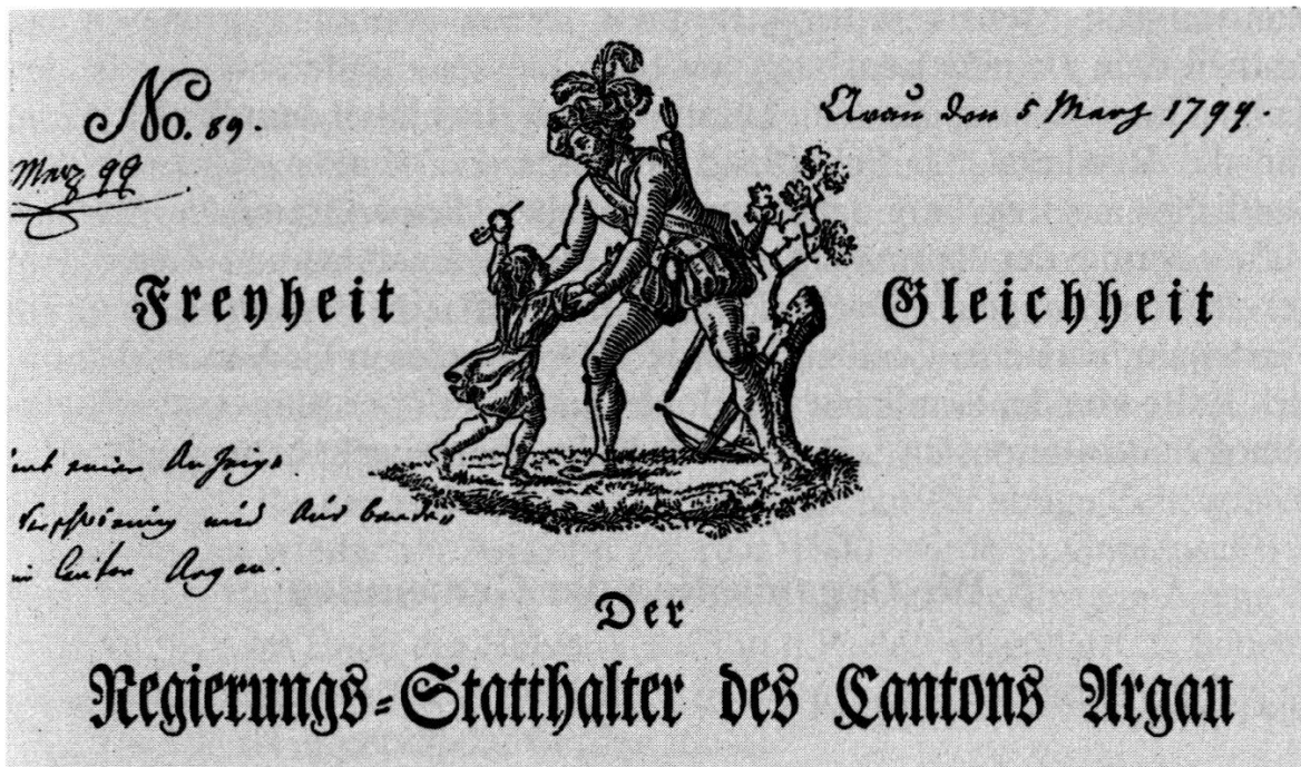
13 Amtlicher helvetischer Briefkopf. Als schmückendes Sujet wurde – wie auch für die staatlichen Siegel – mit Vorliebe Tells Apfelschuss verwendet. Es waren verschiedene zeichnerische Varianten in Gebrauch.