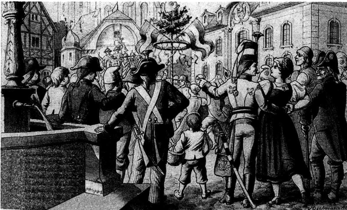
2 Nach dem revolutionären Umsturz richteten die Aarauer am 1. Februar 1798 vor dem Rathaus (rechts) einen Freiheitsbaum auf. Das Bild, wenn auch 100 Jahre später entstanden, gibt die aufgeräumte Stimmung des zusammenströmenden Volkes gut wieder. Der galante Begleiter der jungen Dame rechts trägt einen typisch dreifarbigem Hut. Zeichnung Puschmann, Festkarte der Centenarfeier von 1903.

Der Fall Berns, des Rückgrates der Alten Eidgenossenschaft, bedeutete den Untergang des ganzen schweizerischen Staatenbundes und die rasche Besetzung unseres Landes durch die französischen Invasionstruppen. Die Schweiz wurde zum Vasallenstaat Frankreichs.