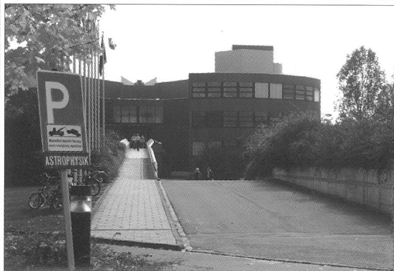
Abb. 1: Eingangsrampe zur ESO-Zentrale in Garching – der Weg zum Himmel ist lang.

Bereiche des Gebäudes. Im ganzen Gebäude ist ein Rundgang markiert, der zu verschiedenen Stationen führt. So stellt sich die ESO auf einem Fernseher gleich nach dem Eingang in einem Präsentationsfilm selber vor. Im Auditorium wird ein Kurzfilm über das VLT-Projekt (Very Large Telescope) gezeigt. In einem verborgenen Winkel des Gebäudes kann man von sich ein Passfoto ausfertigen lassen – mit einer CCD-Kamera. Auf einem Beiblatt wird man über die Funktionsweise einer CCD-