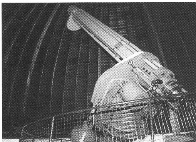
Abb. 4: Der 30-cm-Refraktor im Deutschen Museum, das Schwesterteleskop zur Urania-Sternwarte in Zürich.

um in dem (Eintritt mit Zusatzbillet) täglich Vorführungen besucht werden können. Dieses Planetarium ist nicht das gleiche wie das im Forum der Technik, das an das Deutsche Museum angebaut ist. Ausserdem hat das Museum die Möglichkeit,