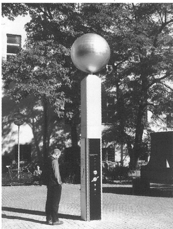
Abb. 3: Die 'Sonne' im Innenhof des Deutschen Museums, der Start des Planetenweg.

Der Tag ist schnell vorbei und bei einem feinen Abendessen im Ratskeller, unter dem Rathaus von München, einigt man sich schnell auf das weitere Programm. Der jüngere Teil der Gruppe entscheidet sich fürs Pla-