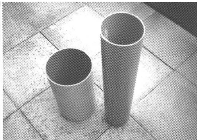
Abb. 1: Zwei Rohrstücke, links Dellit und rechts eine gewöhnliche PVC-Abwasserröhre.

Preisgünstige PVC-Abwasserrohre eignen sich überhaupt nicht für den Teleskopbau. Sie sind schwer, besitzen eine schlechte Biegefestigkeit und lassen sich auch gut