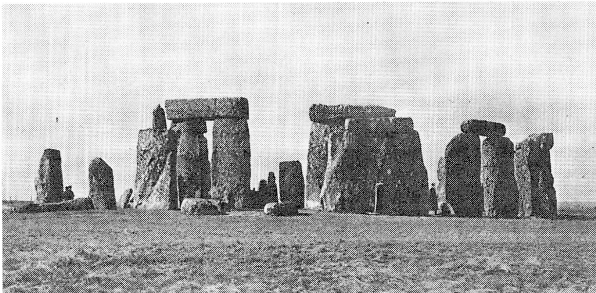
Stonehenge in der Nähe des südenglischen Salisbury

Punkten ausgerichtet, an denen Sonne und Mond zu ganz bestimmten Zeiten auf- und untergehen. Der berühmteste und am höchsten entwickelte Steinkreis ist der von Stonehenge in England, dessen ältester Teil um 2500 v. Chr. als Observatorium zur Beobachtung des Laufs von Sonne und Mond benutzt wurde. Er mag sogar wie eine Art Computer zur Vorhersage von Mond- und Sonnenfinsternissen gedient haben. Aus der Vorstellung, die Gestirne seien Götter, leitete sich der Sternglaube und daraus wiederum die Sterndeutung, die Astrologie, ab. Andererseits führte die regelmässige Beobachtung des Himmels letztlich zur Stern- oder Himmelskunde, der Astronomie.