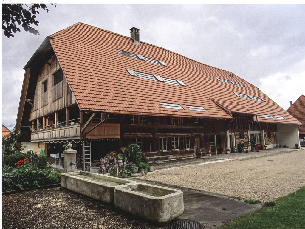
Abb. 1 Lüsslingen-Nennigkofen, Dorfstrasse 20 in Nennigkofen. Das ehemalige Bauernhaus nach der Restaurierung und dem Umbau in einer Ansicht von Südwesten. Foto 2020.

(Abb. 2). In der ersten Hälfte des 20. Jahrhunderts wurden die von der Hochstudkonstruktion geprägten steilen Walmdächer teilweise zu Teilwalmdächern vergrössert. Die Bauernhäuser stehen parallel zur Dorfstrasse in Richtung West-Ost oder Südwest-Nordost (Abb. 3, 4). Bis in die 1950er Jahre verlief hier der offene, beidseits von Strassen gesäumte Dorfbach. Gottfried Loertscher, der erste kantonale Denkmalpfleger, beschrieb diese Situation in einem Bericht an die damalige Altertümer-Kommission: «Dieser Mittelpunkt des Dorfes war von einer selten schönen Geschlossenheit und auch so unverfälscht erhalten, wie kaum ein zweiter Dorfkern im Kanton.» Entgegen seinem Anraten wurde der Bach 1952 an die neue Kanalisation angeschlossen und der Strassenraum ausgeräumt.