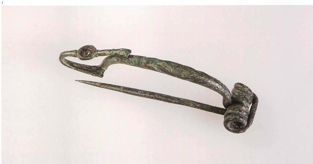
Abb. 1 Die keltische Bronzefibel kam 1929 in einem Grab in Recherswil zum Vorschein. Um 400–350 v. Chr. M 1:1.

In den folgenden Jahren wurde nie mehr ein Versuch unternommen, die Fibel einzufordern. In der 1979 publizierten Arbeit von Alexander Tanner zu den Latènegräbern der nordalpinen Schweiz wird die Fibel aus Recherswil als verschollen aufgeführt.