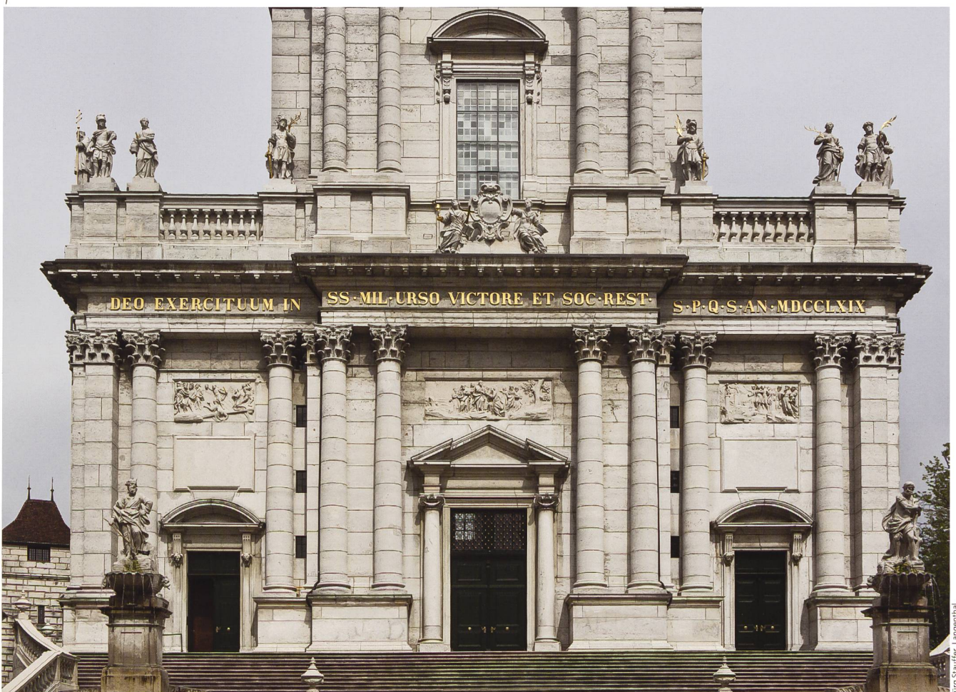
Abb. 1 Solothurn, St.-Ursen-Kathedrale, Ansicht der Westfassade mit den 2010–2013 restaurierten Skulpturen des Bildhauers Johann Baptist Babel: die zehn monumentalen Heiligenfiguren auf der Fassadenbalustrade, das von Allegorien gehaltene Solothurner Wappen in der Mittelachse, die drei Reliefs über den Portalen und die beiden Brunnenfiguren am Fuss der Freitreppe.

Viktor, Verena, Mauritius, Karl Borromäus und Stephan. Das Solothurner Wappen in der Mittelachse wird von den allegorischen Figuren des Glaubens (Religio) und der Stärke (Fortitudo) gehalten. Die Reliefs über den drei Portalen zeigen in der Mitte die Schlüsselübergabe des Erlösers an Petrus, rechts die Verweigerung des Götzenopfers durch Urs und Viktor sowie links deren Enthauptung am Aareufer. Ebenfalls von Babel stammen die beiden Figuren der dreistöckigen Brunnen am Fuss der Freitreppe,