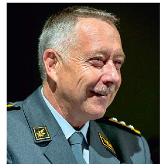
Der Chef der Armee, Korpskommandant André Blattmann, gratuliert zum 100. Geburtstag.

General Ulrich Wille machte sich zu Beginn des 20. Jahrhunderts für eine bessere Bildung der Berufsoffiziere stark. Vor hundert Jahren wurde die erste Militärschule der Schweizer Armee eröffnet. 2011 blickt die Militärakademie an der ETH Zürich (MILAK) auf eine wechselhafte Geschichte zurück.