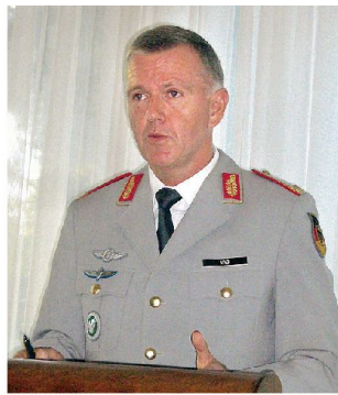
General Dr. Erich Vad.

Im Zentrum der Ausführungen standen die Bundeswehrreform, die Einbindung Deutschlands in der NATO und EU und deren Entwicklung. Nicht nur die Erfahrungen aus den Stabilisierungseinsätzen im Ausland prägen die Bundeswehrreform. Zunehmend würde auch wiederum die territoriale Landesverteidigung und die Bündnisverteidigung an Bedeutung gewinnen. Dabei stünden Bedrohungen durch terroristische Grossereignisse, durch Natur- und Industriekatastrophen im Vordergrund. Die Entwicklungen in der NATO stellen für das Verteidigungsbündnis eine Herausforderung dar, gelte es doch die Frage nach einer fairen Teilung der Lasten und der Verantwortung zwischen den USA und den europäischen Bündnisstaaten zu lösen. In der EU stellt die sogenannte «Gent-