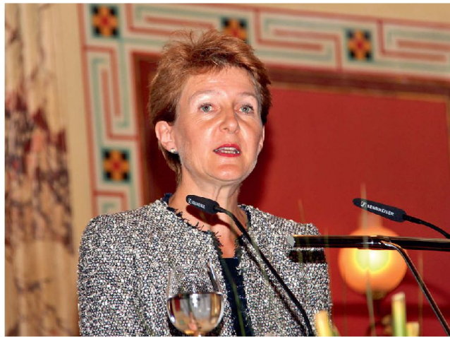
Bundesrätin Simonetta Sommaruga.

Sommaruga wies jedoch auch auf das Dilemma hin, in welchem sich der Rechtsstaat in Bezug auf die Gewalt im Alltag