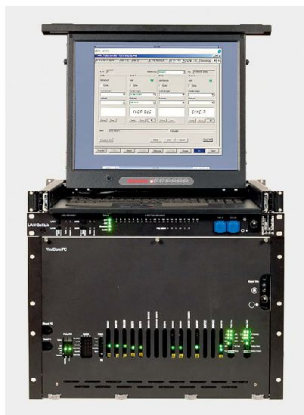
COM Rack Ascom

Communication betrug ca. 120 Mio. Franken mit rund 350 Mitarbeitenden. Security Communication sei mittelfristig nicht profitabel und das Geschäft mit der Schweizer Armee sei grossen Schwankungen unterworfen, dies die Begründung zu diesem einschneidenden Schritt. Ascom hat über lange Zeit die Schweizer Armee mit Produkten und Lösungen im Kommunikationsbereich beliefert. Es wird nun darum gehen, für die im Einsatz stehenden Produkte den Support während deren Lebenszeit sicherzustellen. Ascom hat erklärt, dass die Kundenzufriedenheit auch nach der Veräusserung dieser Sparte im Vordergrund steht. Details zum Verkauf der Sparte Security Communication sind zum jetzigen Zeitpunkt noch nicht verfügbar, doch sollen industrielle Lösungen im Vordergrund stehen. Ma