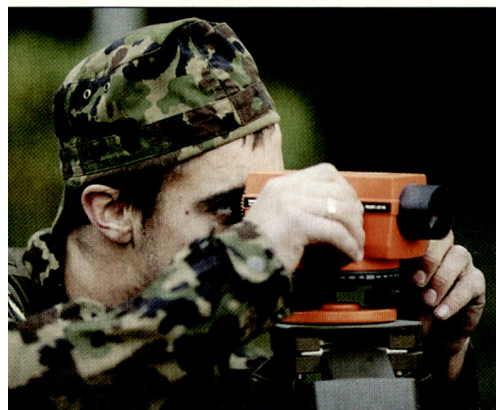
Impressionen aus der Übung Beluga.