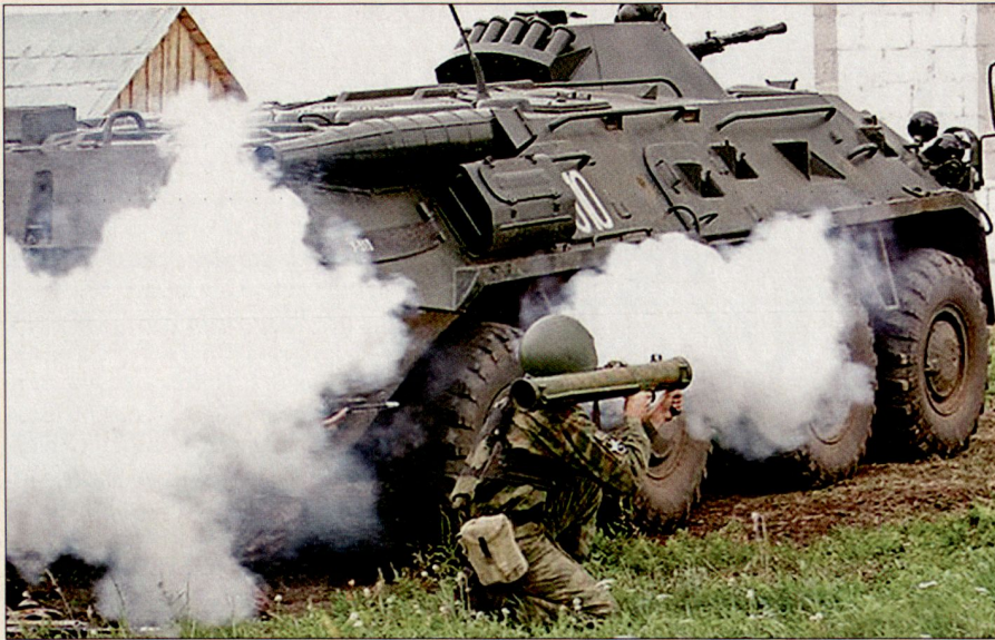
Übung «Friedensmission 2007».

der Nationalen Sicherheit (2000), die Grundlagen der Politik der Russischen Föderation auf dem Gebiet der militärmaritimen Tätigkeit bis 2010 (2000), die Militärdoktrin (2000), die Konzeption der Aussenpolitik (2000) und die Marinedoktrin (2001). Im Dezember 2005 ist durch den Generalstabschef die Ausarbeitung einer neuen Doktrin angekündigt worden. Seit 2004 ist die Verstärkung der zivilen politischen Kontrolle über das Militär nicht mehr nur ein Lippenbekenntnis. Mit dem neuen Verteidigungsminister Serdjukow ist 2007 nach Sergej Iwanow ein weiterer Zivilist an die Spitze des Militärapparates berufen worden.