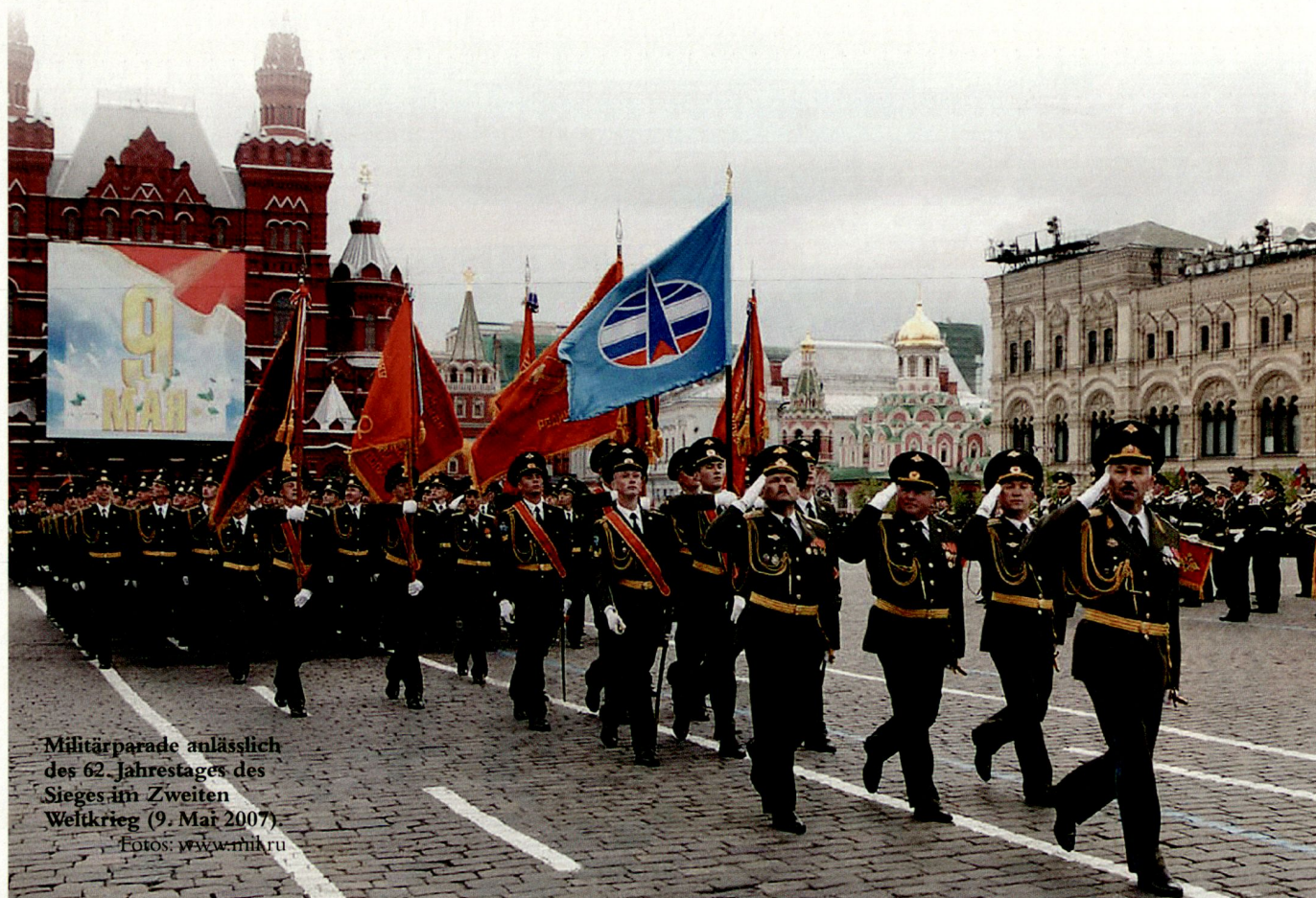
Militärparade anlässlich des 62. Jahrestages des Sieges im Zweiten Weltkrieg (9. Mai 2007).

Die Duma hat im November ein Gesetz verabschiedet, das Russlands vorläufigen Ausstieg aus dem Vertrag über konventionelle Waffen in Europa regelt (CFE). Der Kreml ist der Ansicht, er respektiert nur einseitig den Vertrag, während die NATO immer weiter nach Osten vorstösse. Russland zieht sich so lange zurück, bis die übrigen Signatarstaaten (NATO-Mitglieder) diesen ebenfalls ratifiziert haben.