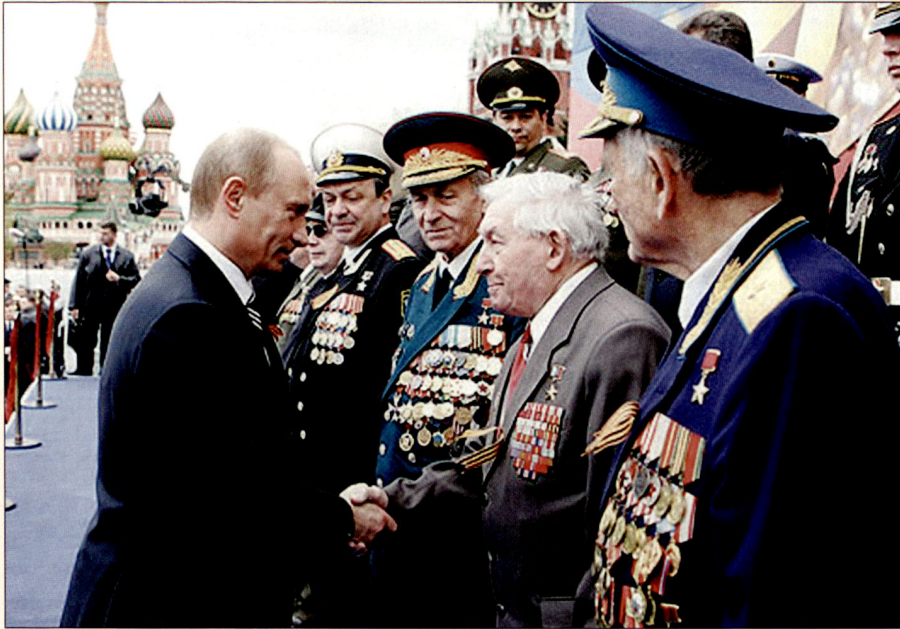
Wladimir Putin trifft Kriegsveteranen.