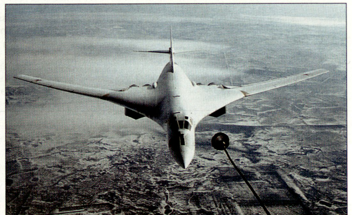
Strategischer Bomber Tu-160 «Blackjack».

gischen Nuklearwaffen schrittweise zu modernisieren. Nachdem bereits vor einiger Zeit die Entwicklung eines neuen nuklearen U-Bootes als Träger für SLBMs bekannt gegeben worden war und vor kurzem ein Testversuch mit der neuen strategischen Lenkwaffe RS-24 (ICBM) durchgeführt wurde, dürfte nun auch die Luftkomponente der nuklearen Triade eine Modernisierung erfahren. Sämtliche luftgestützten strategischen Nuklearmittel Russlands sind bei der 37. Strategischen Luftarmee (früher Fernfliegerkräfte) integriert. Diese ist direkt dem Oberkommando der russischen Luftwaffe unterstellt. Als Einsatzmittel stehen heute nebst einer kleineren Anzahl moderner Bomber Tu-160 «Blackjack» auch noch veraltete Maschinen des Typs Tu-95M im Einsatz. Die neuen strategischen Bomber dürften vor allem für deren Ersatz vorgesehen sein.