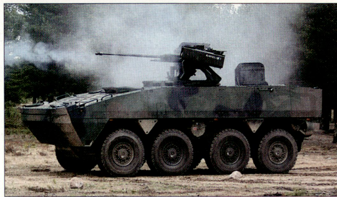
AMV (8x8), das gepanzerte modulare Radfahrzeug, wird in unterschiedlichen Versionen angeboten.

Der nun offiziell bestätigte Auftrag an Patria umfasst 84 Rad-schützenpanzer, wobei die Fahrzeuge sowohl in Finnland als auch in Kroatien selber mit dem dort