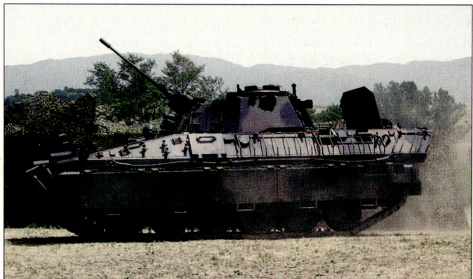
Kampfschützenpanzer «Dardo» bei den italienischen Truppen in Afghanistan.

den. Stark umstritten sind dabei die rund 350 Mio. Euro, die für den Einsatz bei der ISAF in Afghanistan aufgewendet werden müssen. Daneben sind italienische Truppen auch im Libanon (UNIFIL) sowie weiterhin im Kosovo und in Bosnien-Herzegowina en-