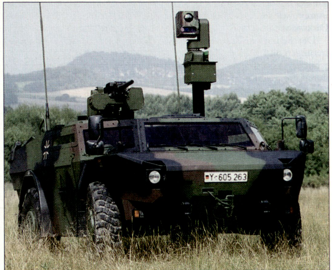
Der Granatwerfer 40 mm wird auch als Bewaffnung des Spähpanzers «Fennek» verwendet.

(Granatmaschinenwaffen 40 mm) im Gange, die vielseitig einsetzbar sind und über nahe und grössere Entfernungen wirken können. Bereits seit Anfang 2004 läuft deshalb die Einführung von GraMaWa (Kaliber 40x53 mm); bisher wurden etwa 200 dieser Waffen der Bundeswehr zugeführt. Theoretisch können bis zu 3400 Schuss in Feuerstössen pro Minute aus der