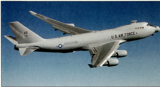
ABL als Teil des amerikanischen BMD-Systems; ballistische Lenk Waffen sollen in der Startphase mit Laserkanonen bekämpft werden.