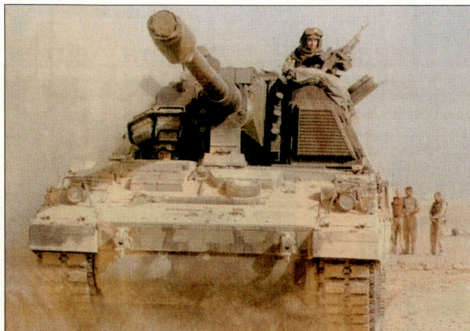
Niederländische PzHb 2000 im Kampfeinsatz gegen Stellungen der Taliban in Afghanistan.

Die niederländischen Streitkräfte stehen gegenwärtig mit etwa 2500 Soldaten bei diversen Operationen im Ausland im Einsatz. In letzter Zeit sind vor allem die Kosten für die in Afghanistan eingesetzten Truppen massiv gestiegen. Zudem müssen dringend Mittel zur Verbesserung des Schutzes eigener Truppen in den Krisenregionen freigemacht werden. So sollen u.a. die Mittel für die Aufklärung sowie die Kapazitäten der Nachrichtendienste ausgebaut werden. Im Weiteren sind dringende Beschaffungen für Personenschutz sowie für Schutzverbesserungen an Fahrzeugen vorgesehen. hg