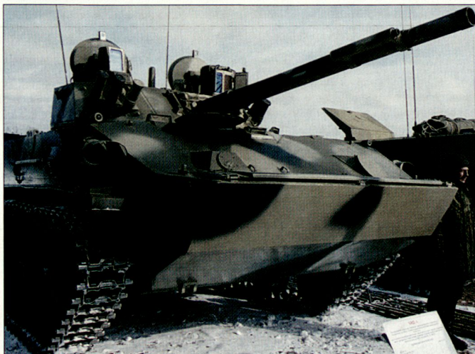
Der neue Luftlandepanzer BMD-4 soll wie seine Vorgänger per Fallschirm abwerfbar sein.

Beim BMD-4 (Bakhcha-U) handelt es sich um einen Luftlan-