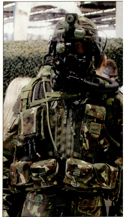
Mit dem «FELIN»-Programm soll die französische Infanterie modernisiert werden. hg

Gemäss vorliegender Planung sollen die französischen Streitkräfte insgesamt 31 000 «FELIN»-Systeme bestellt haben; deren Auslieferung soll bereits im nächsten Jahr beginnen.