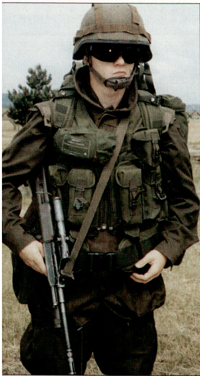
Mit Priorität soll die Ausrüstung österreichischer Soldaten weiter verbessert werden.

Die Kürzungen beim Verteidigungshaushalt führen auch dazu, dass die österreichische Beteiligung an den EU Battle Groups in Frage gestellt werden muss. Ursprünglich wollte sich Österreich mit etwa 200–300 Soldaten an einer Kampfgruppe (Battle Group) beteiligen, das gemeinsam mit Deutschland und Tscheschien geplant worden war. hg