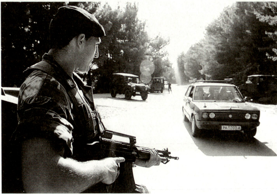
Controllo di rotabile.

L'organizzazione militare apporta un elemento di versatilità importante al dispositivo posto in atto in quanto, non essendo soggetta alla compartimentazione della ripartizione amministrativa, può agire senza dover rispettare i limiti provinciali ed offre un ventaglio di possibilità d'intervento, assicurato dall'entità degli uomini impegnati, dalla polivalenza dei reparti (varietà dei mezzi ed equipaggiamenti a disposizione) e dall'autonomia logistico-funzionale.