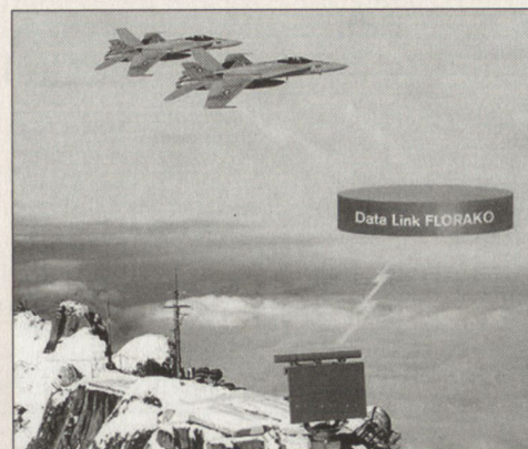
Integration Data Link FLORAKO

Die internationale Friedensunterstützung und Krisenbewältigung wird ihre Bedeutung langfristig beibehalten, und die Bedürfnisse betreffend Lufttransportkapazität werden eher zunehmen. Heute verfügt die Schweizer Armee über keine geeigneten Lufttransportmittel. Mit der Beschaffung von zwei Transportflugzeugen vom Typ CASA C-295M sollen vor allem Einsätze im Rahmen der Humanitären