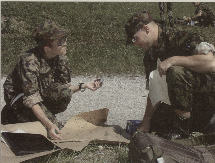
In Spitzenlehrgängen werden Offiziere auf ihre Funktionen vorbereitet.

Die Gültigkeit des Leitbildes erstreckt sich über einen längeren Zeitraum. Es wird dann verändert oder neu verfasst, wenn die Vorgaben des Chefs der Armee oder das Umfeld grundlegend geändert haben. Zwei der acht Ziffern des Leitbildes (Ziffer 3 und 6) sprechen direkt den Bezug der militärischen Kaderausbildung zum zivilen Umfeld an. Wer sich der Armee als Kader zur Verfügung stellt, soll einen «return on investment», einen wahrnehmbaren Mehrwert für sein berufliches Umfeld, zurück-erhalten.