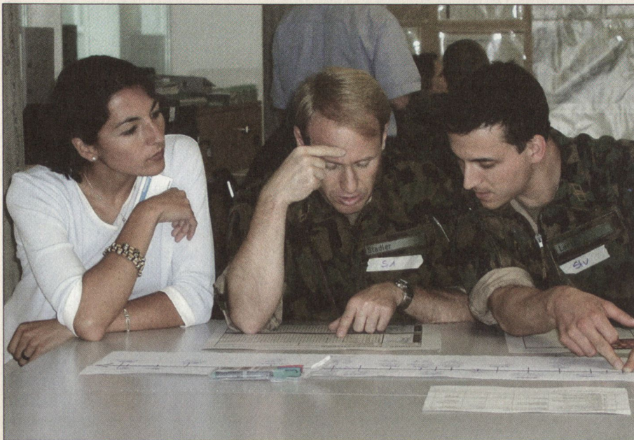
Militärische Kurse für zivile Führungskräfte.