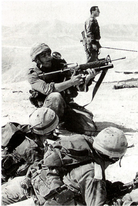
Die Ausbildung der israelischen Soldaten liegt fast ausschliesslich in der Verantwortung von jungen Offizieren, die nicht viel älter sind als die Soldaten, welche sie ausbilden und in den Kampf führen.

mie, sondern aus einer zweijährigen Kampf- und Führungserfahrung, welche die Führer rasch für eine höhere Verantwortung reifen lässt.