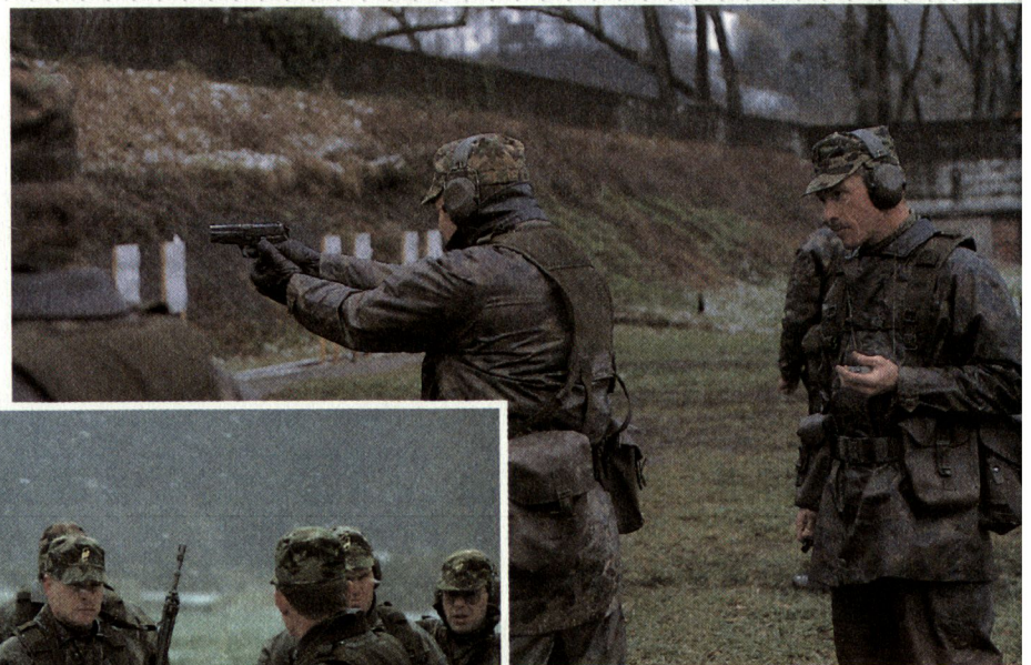
Als Soldat bemüht sich der Instruktor täglich, ein Vorbild zu sein für die übrigen Angehörigen der Armee: Abb. Schiessausbildung beim Infanterie-Ausbildungszentrum Walenstadt.