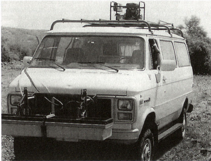
«Bodendurchdringendes Radargerät» GPR zur Minenaufklärung, das an jedem Fahrzeug angebracht werden kann.

nenräumrollen MCRS (Mine Clearing Roller System) für Kampfpanzer, die dem früheren sowjetischen Räumsystem KMT-5 entsprechen. Das System wird in modifizierter Form weiterhin zum Verkauf angeboten.