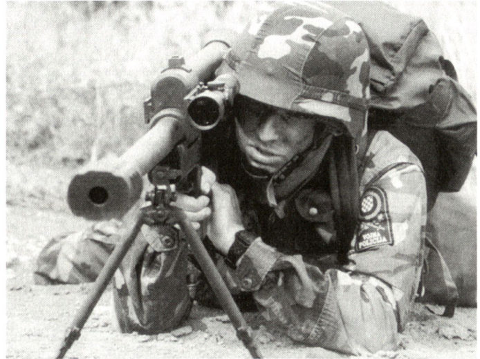
Prototyp eines kroatischen Scharfschützengewehres vom Kaliber 20 mm.

beim südafrikanischen Modell sowie 20x110 mm beim kroatischen Typ, umfassen Sprengbrand- und panzerbrechende Munition, wobei auf kürzere Distanzen eine Durchschlagsleistung von gegen 20 mm Stahl erreicht werden dürfte. Aus naheliegenden Gründen muss bei diesen grosskalibrigen Gewehren der Rückstossminimierung besondere Beachtung geschenkt werden. Die maximale Einsatzdistanz der rund 1,8 m langen Gewehre soll bis zu 1500 m betragen. Vorgesehen ist deren Ausrüstung mit modernen Ziel- und Nachtbeobachtungsgeräten. Die von Kroatien vorgestellte Waffe wiegt ca. 25 kg und kann in zwei Traglasten zerlegt werden. Je nach Einsatzart dürften unterschiedliche Munitionsmagazine zur Verfügung stehen. hg