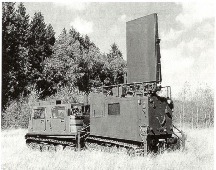
Ab 1997 wird das Artillerieradar ARTHUR an die schwedische Armee ausgeliefert.

Im schwedischen Verteidigungsplan wurden bereits vor einigen Jahren zusätzliche Mittel für die Bereiche Aufklärung,