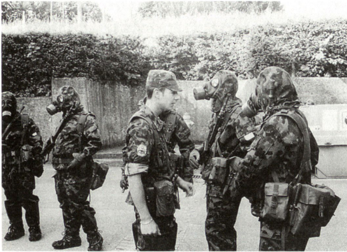
Abb.2: Zugführer beim praktischen Unterricht mit der Schutzmaske.