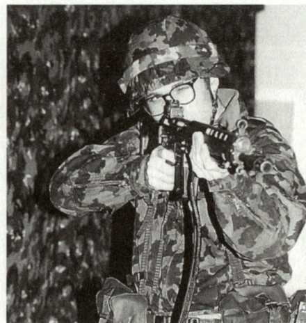
Eine fehlerfreie Waffenhandhabung ist eine Voraussetzung, um im Schiesskino erfolgreich zu bestehen. Auffallend der Schlauch zur elektropneumatischen Simulation des Waffenverschlusses.

■ Der Operator betreibt und bedient das System. Er erhält die Anweisungen zu den einzelnen Übungen vom Übungsleiter.