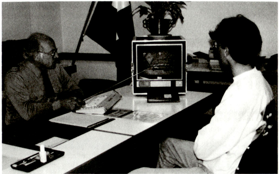
Zuteilungsgespräch mit modernstem Medienmittel.

Es liegt auf der Hand, dass bei niedrigen oder geringeren Anforderungen an die physische Leistungsmöglichkeit die berufsbezogenen Fähigkeiten stark in den Vordergrund treten.