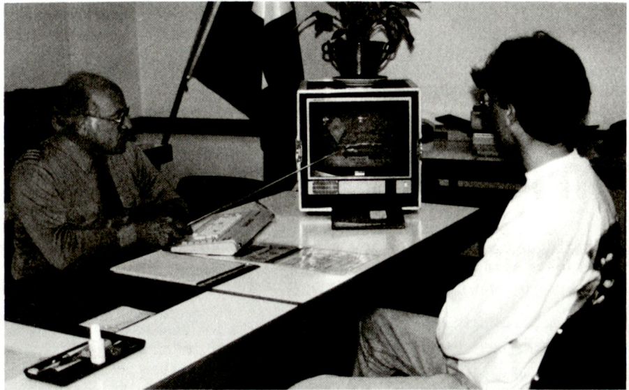
Zuteilungsgespräch mit modernstem Medienmittel.

Es liegt auf der Hand, dass bei niedrigen oder geringeren Anforderungen an die physische Leistungsmöglichkeit die berufsbezogenen Fähigkeiten stark in den Vordergrund treten.