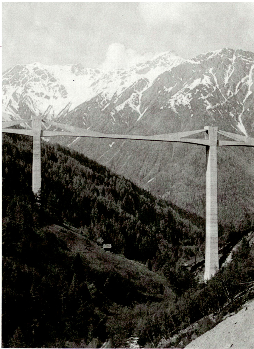
Offenhalten, nicht mehr zerstören, um jeden Preis und in jeder Situation (Ganderbrücke, Simplonpass)

Ausgehend von politisch-strategischen Überlegungen hat der Bundesrat wichtige Entscheide für unser mili-