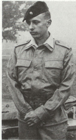
Soldat des tschechoslowakischen Truppenkontingents im Golfkrieg.

Wenn der Rückzug der 6. US-Flotte nicht mit der gleichzeitigen Rücknahme der 5. UdSSR-Eskadra aus dem Mittelmeer gekoppelt würde, sähe sich Italien der Präsenz von heute 7 Schlachtschiffen, 6 U-Booten und 31 Hilfsschiffen der UdSSR gegenüber. Diese ankern in der Regel nicht weit von Italien weg: Im Golf von Hammamet (Tunesien), im Golf von Sollum (Libyen) und während Übungen vor dem Capo Passero (Sizilien). In diesem Fall müssten die U-Boot-, Schiffs- und Fliegerabwehr sowie die Aufklärung verstärkt werden: Vielleicht in Zusammenarbeit mit Frankreich und Spanien und weiteren europäischen Partnerländern, um die NAVOCFORMED (Naval On Call Force Mediterranean) in einen ständigen kampfstarken Verband umzuwandeln. Bt