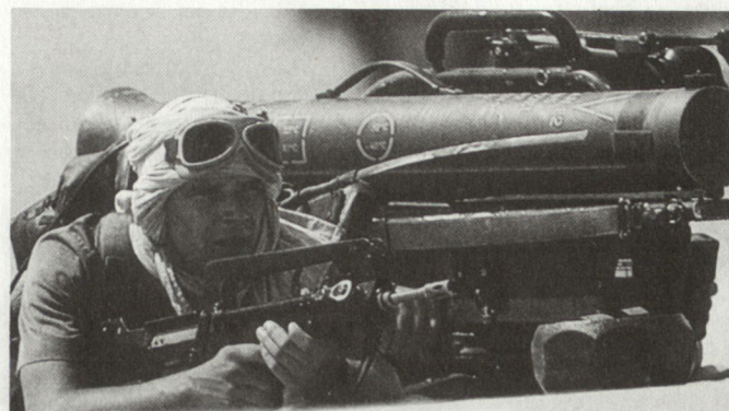
Französischer Soldat im Golfkrieg, ausgerüstet mit PAL-System Milan.

Gemäss Aussagen von Verteidigungsminister Pierre Joxe sind gegenwärtig folgende Pla-