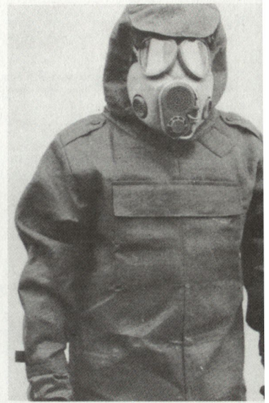
Standardausrüstung der ABC-Schutzeinheit: Neue Schutzmaske M-10M und kombinierter Schutzanzug FOP-85.

Die eingesetzten tschechoslowakischen Soldaten waren als erste ihrer Streitkräfte mit der neuen Schutzmaske M-10M und dem kombinierten Schutzanzug FOP-85 versehen. Beide Produkte stammen aus eigener tschechoslowakischer Produktion. Beim FOP-85 soll es sich um einen sogenannten Filtrationsschutzanzug, bestehend aus einem kohlestoffhaltigen Spezialgewebe, handeln. Die Leute des chemischen Zuges waren mit Anzügen des