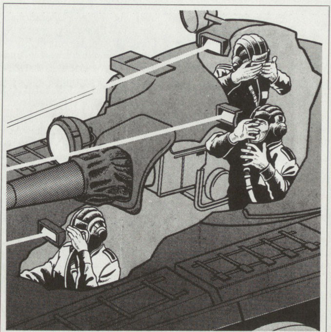
Mögliche Wirkung einer Laserkanone: Der auf die Periskope gerichtete Laserstrahl blendet die Besatzung und setzt sie ausser Gefecht.

Der für strategische Interventionen vorgesehene Verband wird vor allem für Nacheinsätze ausgebildet. Etwa 90 Prozent der Trainingseinsätze und -absprünge werden in der Nacht durchgeführt. Rückgrat der Fallschirmjägereinheiten bilden die Berufs-