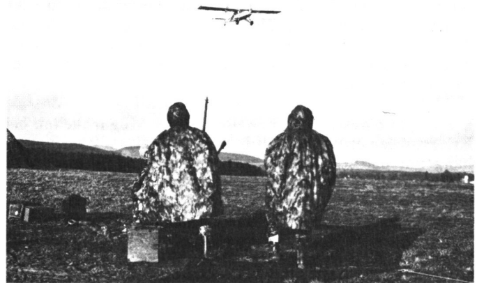
Bild 3. Sprüh-Porterflugzeug im Einsatz.

rot. Pro Einsatz können mittels 600 Liter Flüssigkeit zwei Ziele von 400 x 120 m aus einer Flughöhe von zirka 30 bis 50 m belegt werden.