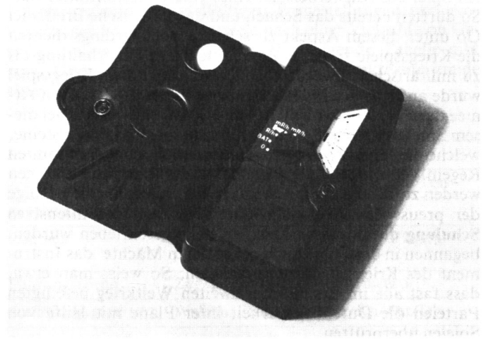
Bild 2. Empfänger, der wie ein A Spürgerät 73 aussieht.