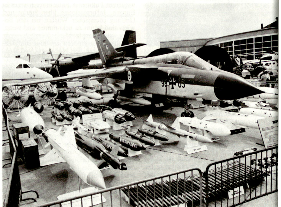
Tornado mit Erdkampf Bewaffnungsvarianten

Die absolvierten Tests unter tornado-spezifischen Tiefflugbedingungen im hohen Geschwindigkeitsbereich stellen einen weiteren wichtigen Schritt auf dem Wege zur operationellen Einsatzreife des europäischen Allwetter-Kampfflugzeuges dar. pb