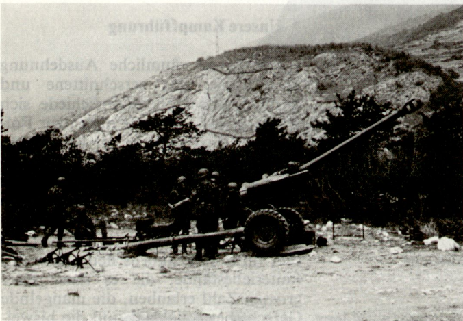
Bild 2. 10,5-cm-Light-Gun im Truppenversuch.