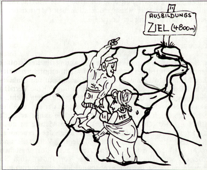
Bild 3. Verbund von Didaktik und Methodik.

«Methoden im strengen Sinne des Wortes gibt es nur als Wege zu bestimmten Zielen, und ob ein Weg richtig oder falsch, angemessen oder unangemessen ist, das richtet sich eben danach, ob er zum Ziele führt. Also: Man muss das Ziel kennen, um über den Weg entscheiden zu können ... Methoden können nur entworfen und bewertet werden, wenn didaktische Vorentscheidungen gefallen sind, und umgekehrt: Jeder methodische Entwurf schliesst immer schon – bewusst oder unbewusst – didaktische Voraussetzungen ein 2 .»