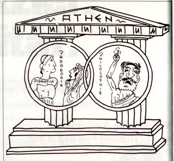
Bild 1. Didaktische und methodische Fragen beschäftigten schon die alten Griechen.

Die Begriffe «Didaktik» und «Methodik» kommen aus der Erziehungswissenschaft. Sie sind in die militärische Aus-bildungspraxis der deutschsprachigen Länder längst über-nommen worden, wobei über ihre Inhalte, Abgrenzungen und Zusammenhänge nicht immer Einigkeit herrscht. Der folgende Beitrag beschreibt beide Bereiche , um daran an-knüpfend ihre Bedeutung für die wehrpädagogische Praxis aufzuzeigen.