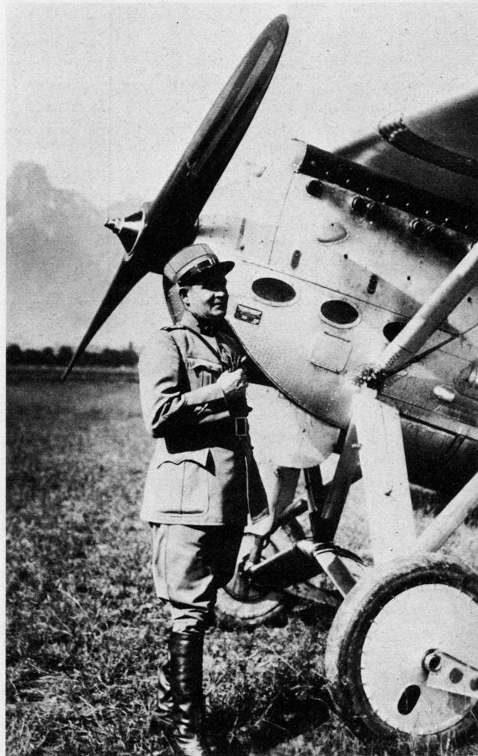
Bild 3. Hptm Adolf Schaefer, Flugzeug D 27, Baujahr 1928, 500-PS-H.S.-Motor, Lizenz Saurer/LFW, Maximalgeschwindigkeit 300 km/h.