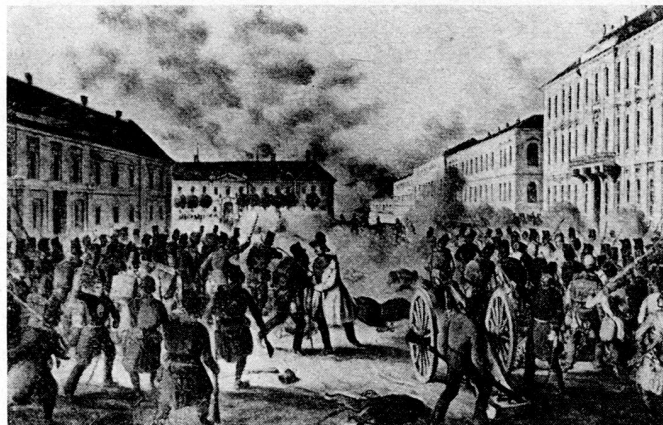
Bild 5. Der Tod General Hentzis während des Endkampfes in der Festung.

Drei Angriffe waren nötig, bis die Honvéds die Wälle an den vorgesehenen Punkten bezwingen konnten. Sie erlitten dabei schwere Verluste. Doch endlich waren sie oben in der Festung – nicht zuletzt durch die tatkräftige Unterstützung seitens der Jäger des Ceccopierie-Bataillons, die von der Brustwehr aus behilflich waren, den Anstürmenden die Leitern anzulegen, und den Honvéds ihre Hände herabreichen, um sie über die Brustwehr hinaufzuziehen. Mit dem Erscheinen der Honvéds auf den Basteien schlossen sich auch viele Italiener den Ungarn an und drangen gemeinsam mit ihnen in das Innere der Festung ein. General Hentzi gab jedoch den Kampf noch nicht auf. Er zog sich mit dem Rest seiner Truppen auf den Györgyplatz zurück und versuchte, durch rasch herbeigeschaffte Geschütze die Honvéds mit Kartuschen von der Bastei zu vertreiben. Danach befahl er einen Gegenangriff, den er mit gezogenem Säbel selbst zu führen beabsichtigte. «Nur vorwärts!» rief er dabei den kroatischen Infanteristen zu. «Kinder, stürmt! Ihr müßt sie hinauswerfen!» Dies waren Hentzis letzte Worte. In dieser Minute traf ihn eine Gewehrkuugel in die rechte Magenseite. Er starb nach einigen Stunden in einem Notspital, ohne daß er den Fall der Festung erlebt hätte.