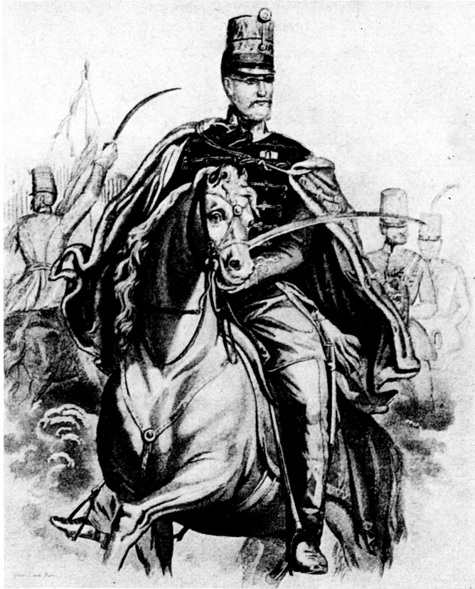
Bild 2. Honvédgeneral Arthur Görgey, Oberbefehlshaber der Honvédtruppen und der Belagerer der Festung Buda.

Wien selbst bedrohenden Offensivoperationen fortwährend in Feindesgewalt bliebe 2 .»