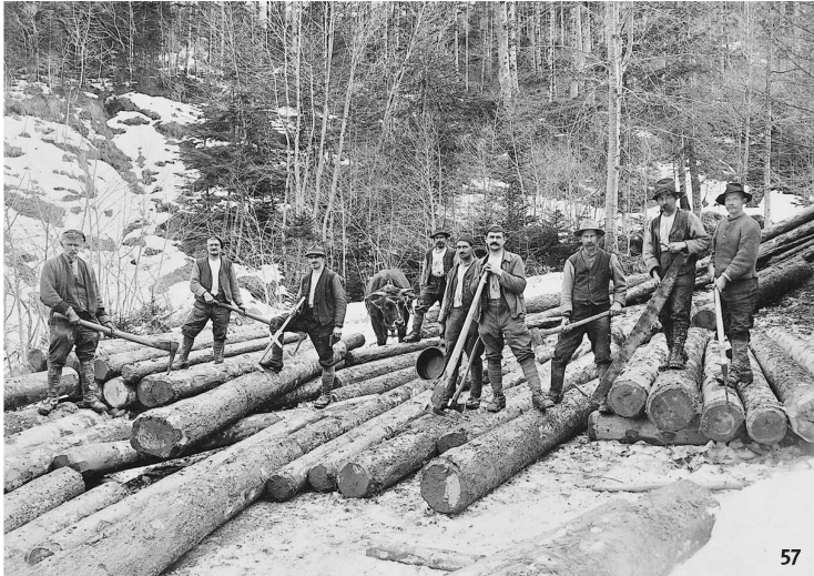
Fig. 57 Bûcherons au travail, début du 20 e siècle.

Boscaioli al lavoro, inizi del XX secolo.