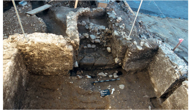
Cave maçonnée des 13 e -14 e siècles. On distingue notamment les premières marches de l'escalier et le logement prévu pour un poteau de bois (à droite).

de chaleur (le poêle à catelles par exemple), mais leurs dimensions notamment rendent cette interprétation peu convaincante. Simon Maier, Andrea Rumo