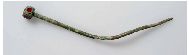
Un objet précieux perdu en chemin. Cette épingle de bronze à tête polyédrique, de la première moitié du 7 e siècle, est une découverte isolée: contrairement au cas le plus fréquent, elle n'a pas été recueillie dans une tombe (longueur 10 cm).

Cantina murata del XIII-XIV secolo: si notano tra l'altro i resti di una scala e l'incavo per un sostegno interno di legno (a destra).