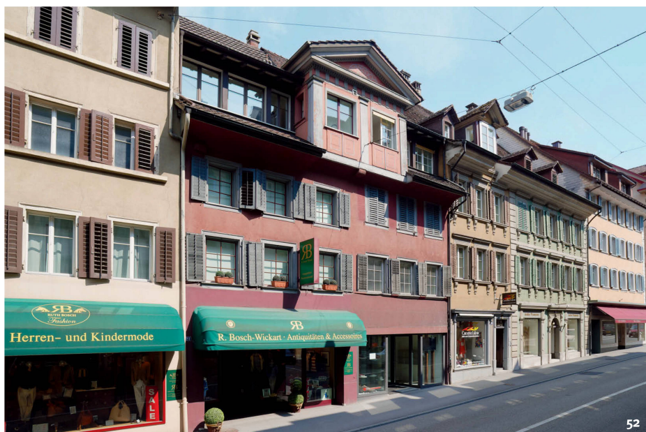
Fig. 52 Vue extérieure actuelle de la maison au numéro 23 de la Neugasse à Zoug. Maintes fois transformée et agrandie, elle conserve encore son noyau primitif, une construction à poteaux et planches de 1482 qu'évoquent encore la position et les dimensions du rez-de-chaussée et des deux étages.

Veduta esterna della casa attuale alla Neugasse 23: sotto i ripetuti rifacimenti e gli ampliamenti si cela l'edificio originale a pali e tavolato su costruzione del 1482. A questa costruzione rimandano, guardando l'esterno, la posizione e le dimensioni del piano terra e dei piani superiori.