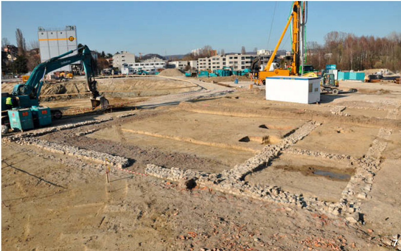
Fig. 7 Vue d'ensemble de la partie est du bâtiment 3.

Ansicht der Ostseite von Gebäude 3. Veduta complessiva della parte est dell'edificio 3.