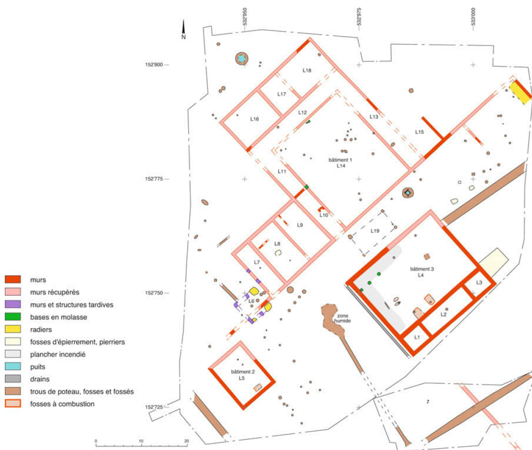
Fig. 3 Plan de la villa. Plan der Villa. Pianta della villa.