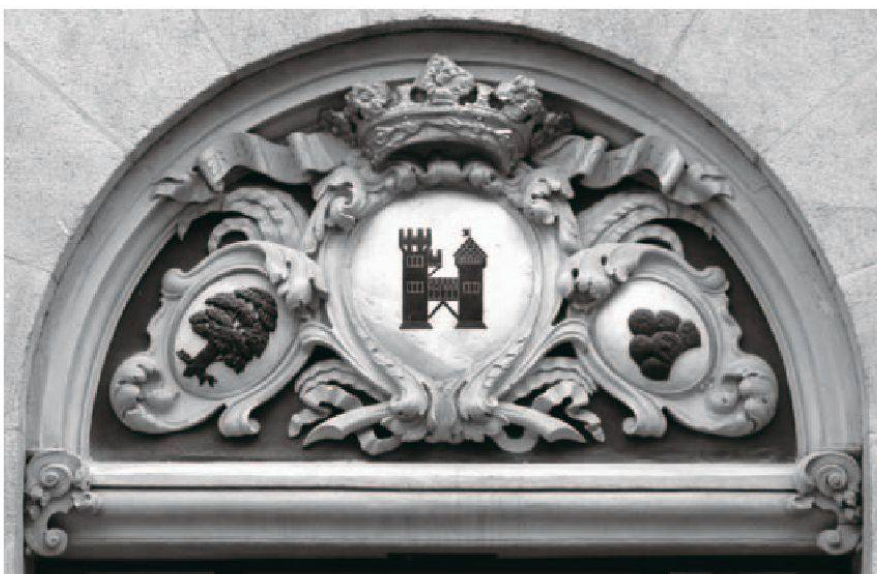
3 Samuel Jenner entwarf um 1700 das Tympanon für das Hauptportal des Kornhauses in Brugg. Der Schild mit dem getilgten und übermalten Wappen der Stadt Bern trägt die Souveränitätskrone. Beigestellt sind die Wappen des Deutschseckelmeisters Johann Rudolf Bucher und Bernhard Effinger, Obervogt zu Schenkenberg. Die Inschrift lautet: «ERBAVWEN / ANO 1701» (Foto: Manuel Kehrli, 2012).