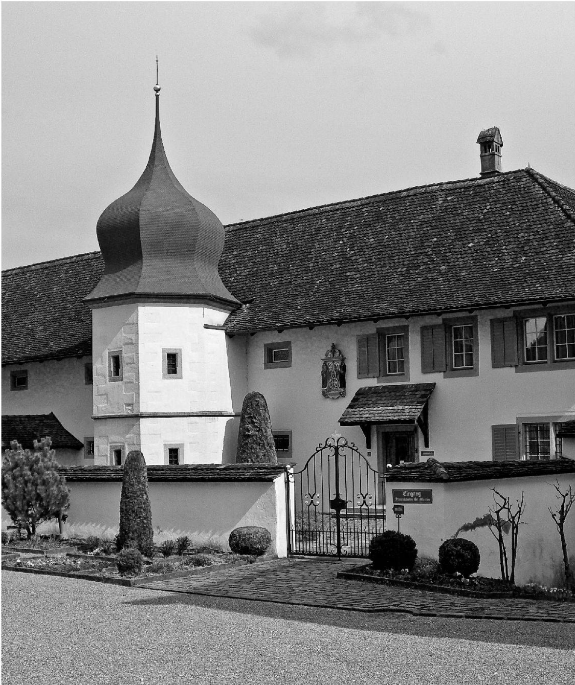
Das Kloster Hermetschwil: Sichtbar sind die Klosterpforte sowie der Archivturm aus dem Jahr 1673 (Foto: Ruth Wiederkehr).

Anzahl an Gebetbüchern aus Frauenklöstern, ist daher kaum in Frage zu stellen. «Anvachen sold du ein rei güt götlich leben, B böses sollt du miden, gütés davir tûn. [...] [...] z zame und zwing din natur und din hertz, daz si lernend in allen dingen frid han, die gott getût.» 57 Texte wie dieses Abecedarium vermitteln einen Tugendkatalog aus dem spätmittelalterlichen Nonnenleben. Sie zeigen zudem, dass nicht nur das Lesen, sondern auch das Auswendiglernen und Erinnern wichtiger Be-