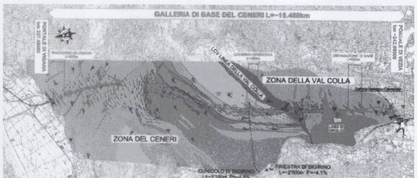
2- La situazione geologica