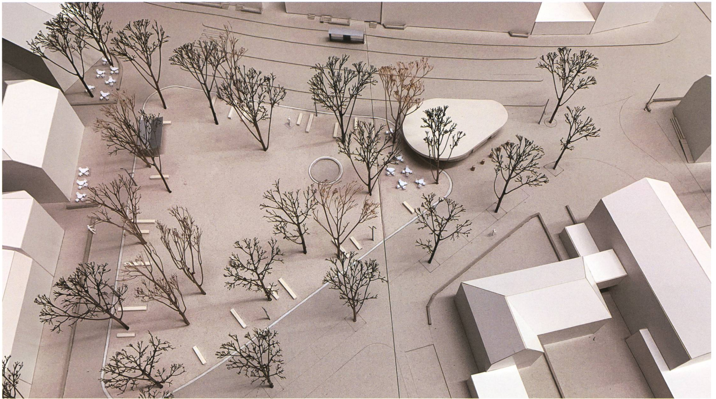
META Landschaftsarchitektur (4)

Lindenplatz Allschwil, 1. Rang Studienauftrag Januar 2019, momentan Bearbeitung des Bau- projekts.