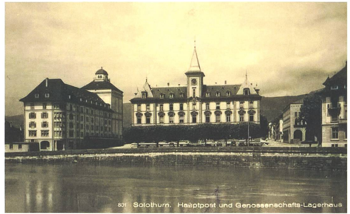
4 801 Solothurn. Hauptpost und Genossenschafts-Lagerhaus

historischen Baumreihen mussten aus Platzgründen weichen; dort, wo noch Platz war, wurden nur noch wenige neue Bäume gepflanzt.