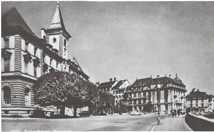
3 Zentralbibliothek Solothurn: Ansichtskarten Postplatz Solothurn (2)