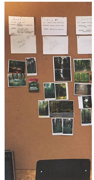
3 Die Erforschung von Waldbildern während des Wettbewerbs. Étude d'images de forêts lors du concours.

Notre travail consiste à écouter la forêt et à la réguler de manière à la fois subtile et stimulante. À la différence du laboratoire forestier suédois, où sols et plantations peuvent être librement associés, le Butzenbüel est soumis à de nombreuses restrictions qui favorisent d'autant plus la gestion créative: hauteur limitée des arbres dans le périmètre de l'aéroport, sols plissés, rhizomes tenaces, possibilités res-