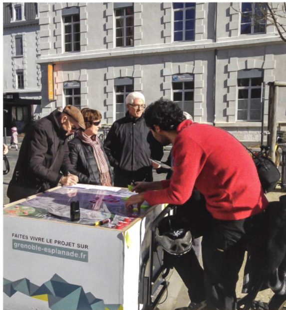
Architecture In Vivo