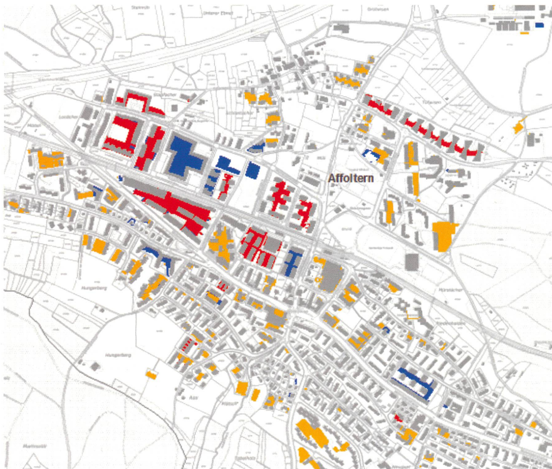
2 Ausmass und Veränderungen der Unterbauungen in Affoltern. Dimensions et changements des ouvrages souterrains à Affoltern.