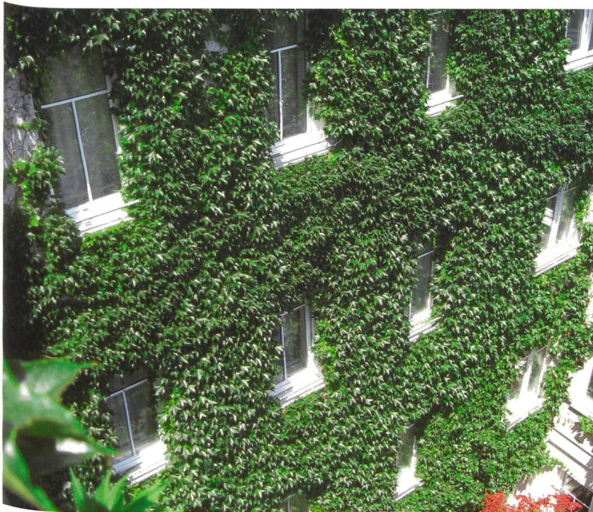
Azra Korjenic (3)