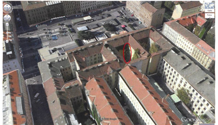
Google Maps (2)