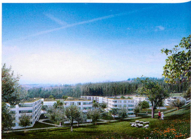
Maaars Visualisierung, David Klemmer