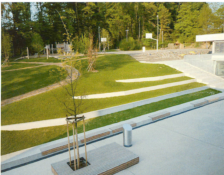
raderschall partner ag landschaftsarchitekten bsia sia

Die campusartige Abfolge von Plätzen, Wegen und Durchgängen wurde für die Aussenanlagen auch beim Erweiterungsbau des Schulhauses Nägeli-moos wieder aufgenommen. Umgebungsgestaltung (raderschallpartner ag landschaftsarchitekten bsia, Meilen)