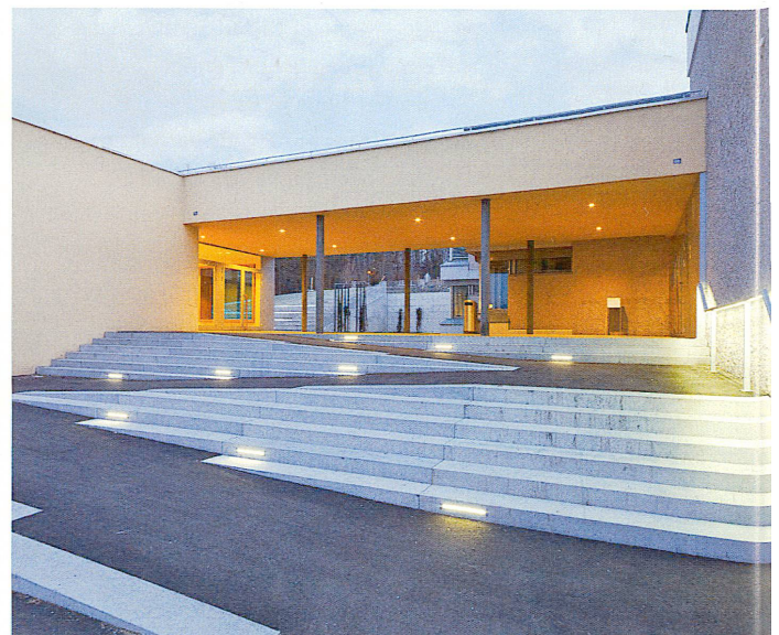
Zeljko Gataric Fotografie