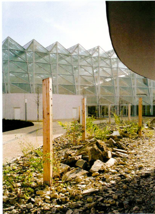
Stelen im Schotterfeld mit integrierten Nistkästen.

Mehr als 100 Bäume wurden neu gepflanzt. Die Wiesen erhielten eine Samenmischung von typischen Dessauer Wiesenpflanzen. Einzelne Flächen entwickeln sich im Laufe der Zeit zu einem Wald. Alles, was nicht bebaut wurde, wurde begrünt, um die Sauerstoffproduktion anzuregen.