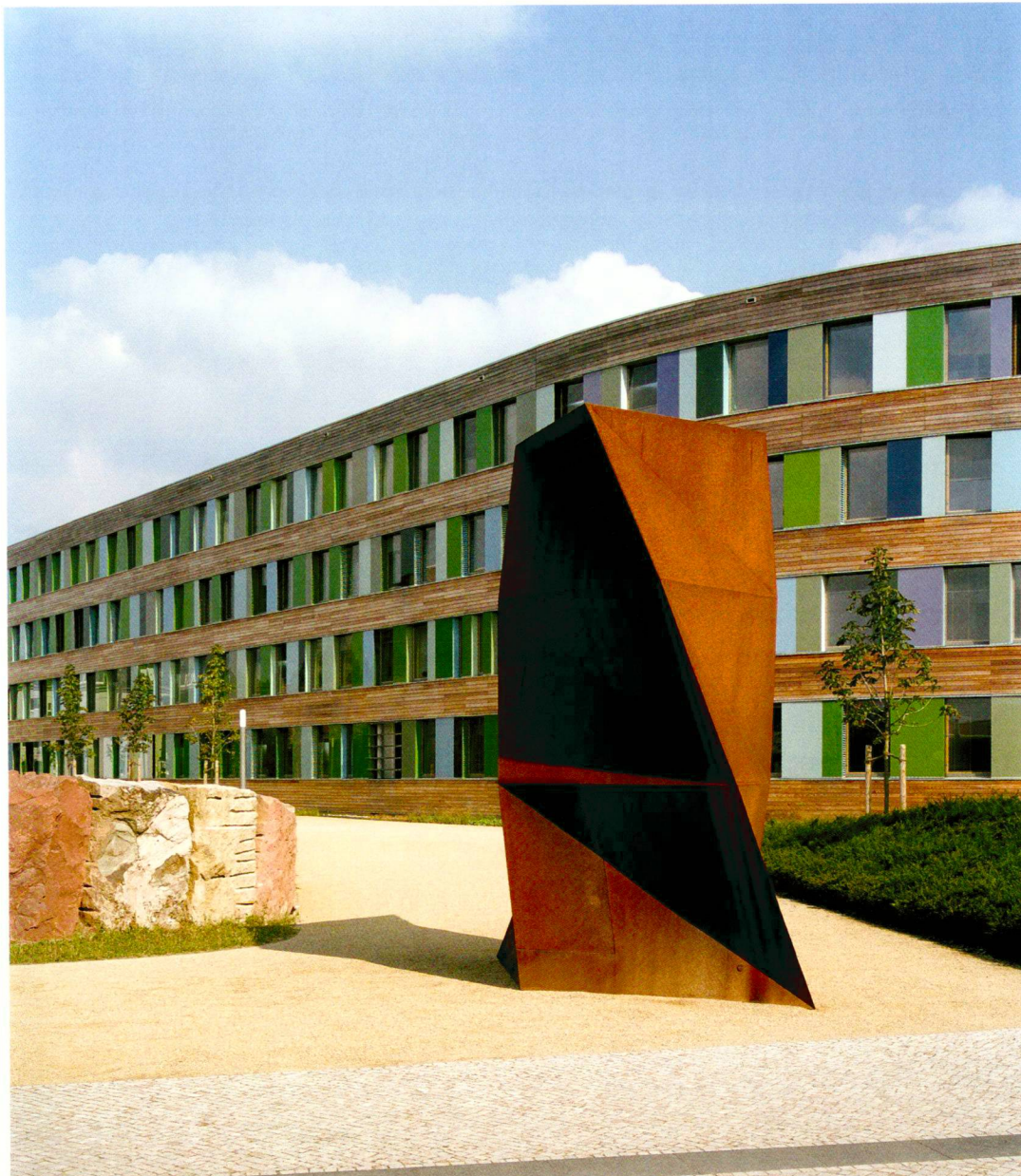
ST raum a. (3)

Les architectes ont conçu le bâtiment de manière si compacte qu'une grande partie du terrain reste disponible pour les aménagements extérieurs. L'atrium du bâtiment sert de zone tampon climatique. La bonne isolation thermique du bâtiment, le système de récupération de la chaleur ambiante et, en hiver, le préchauffage des apports d'air par une pompe à chaleur géothermique contribuent à réduire les pertes de chaleur par aération. En été, l'isolation thermique est améliorée par un dispositif de protection solaire flexible devant les bureaux, des collecteurs thermiques solaires et des modules photovoltaïques. La profondeur relative-