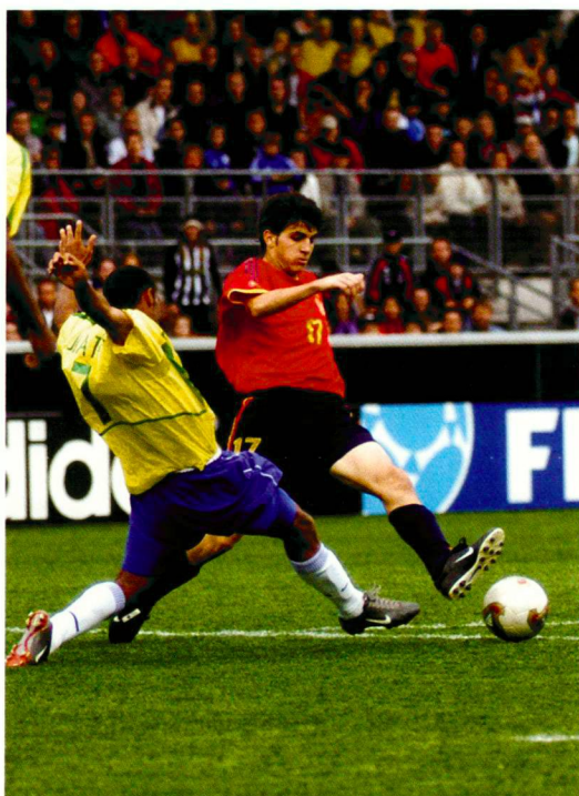
U 17-Weltmeisterschaft 2003 in Helsinki auf Kunstrasen.

Coupe du monde U 17, 2003 à Helsinki, sur du gazon artificiel.