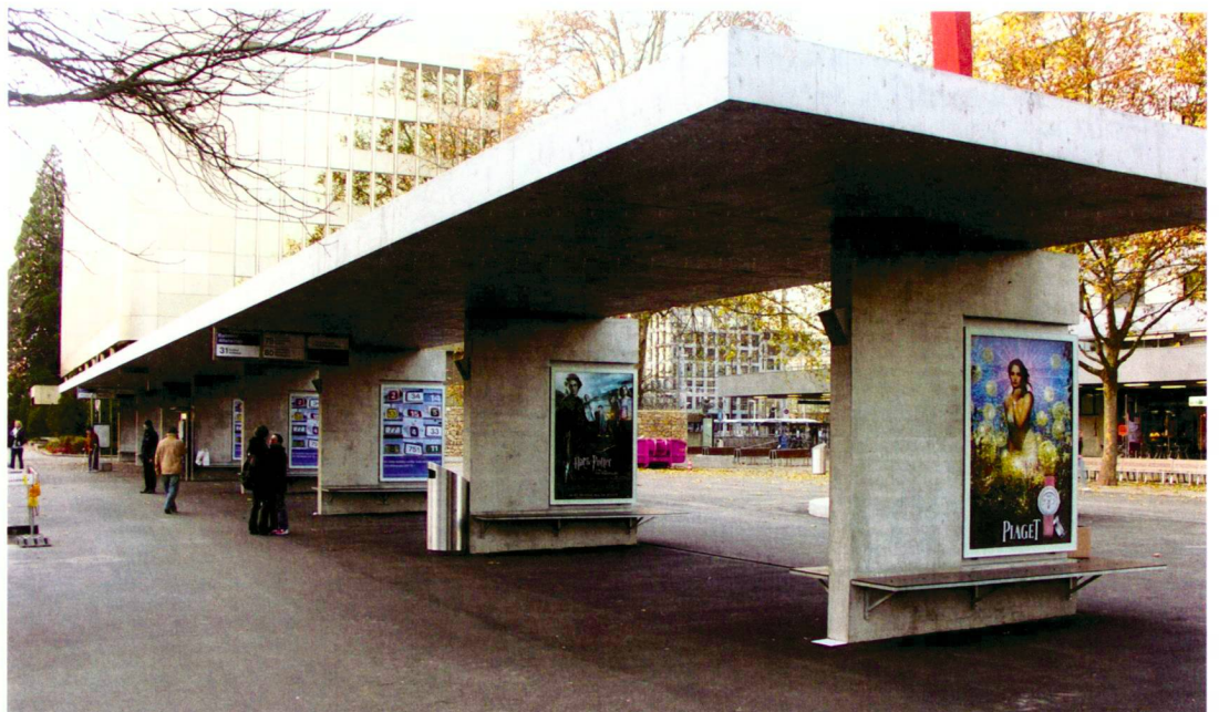
Das lange Dach als transitorische Platzbegrenzung.

La sculpture en fer coloré de l'artiste Bernhard Luginbühl, sise sur un piédestal en escalier, était déjà en place sur l'ancien parvis de la gare. En accord avec l'artiste, la sculpture a été déplacée et dotée d'un nouveau socle. Elle a ainsi maintenant sa