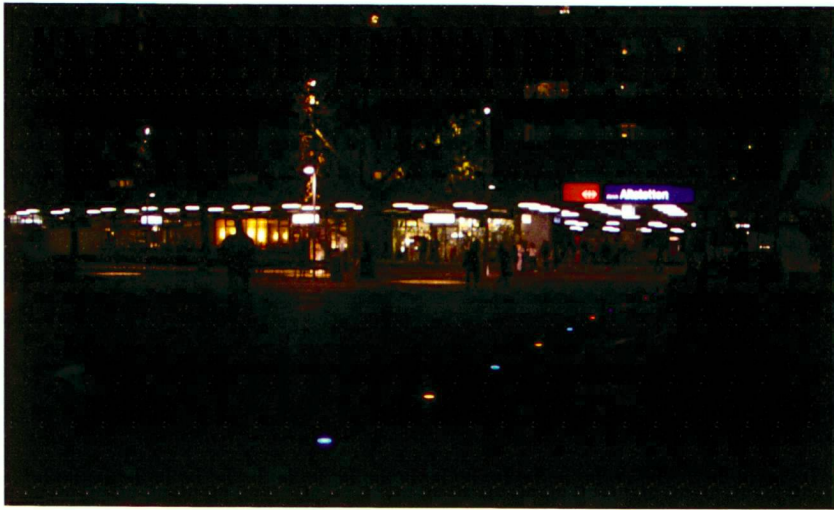
Nächtliche Stimmung (oben). Sitzbank mit Abstellfläche (Mitte).