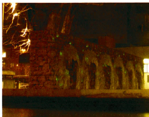
Impressionen zur Steinkorbmauer im Wasserfeld.

Vues du mur de gabions dans le bassin d'eau.