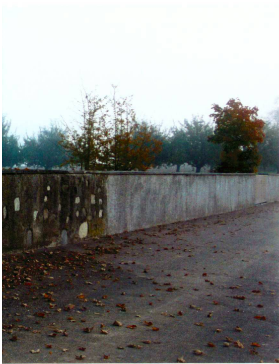
Rotzler Krebs Partner

des sépultures. La transition vers la nouvelle partie du cimetière est suggérée par une haie de lilas blancs. Dans les nouvelles zones de sépultures, des bandes de narcisses esquissent les futures rangées des tombeaux.